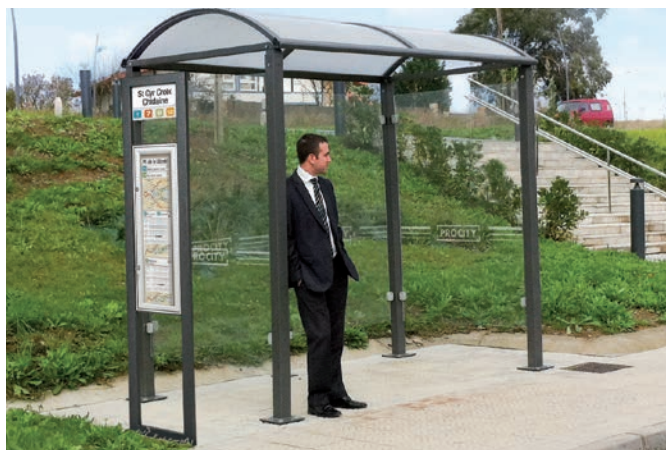
Réf. 529445 Signalétique non fournie