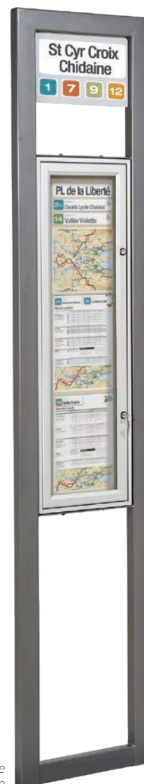
Signalétique non fournie