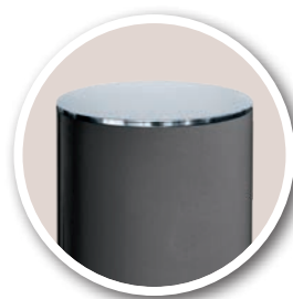
Ø 219 mm, Couvercle Inox réf. 206537